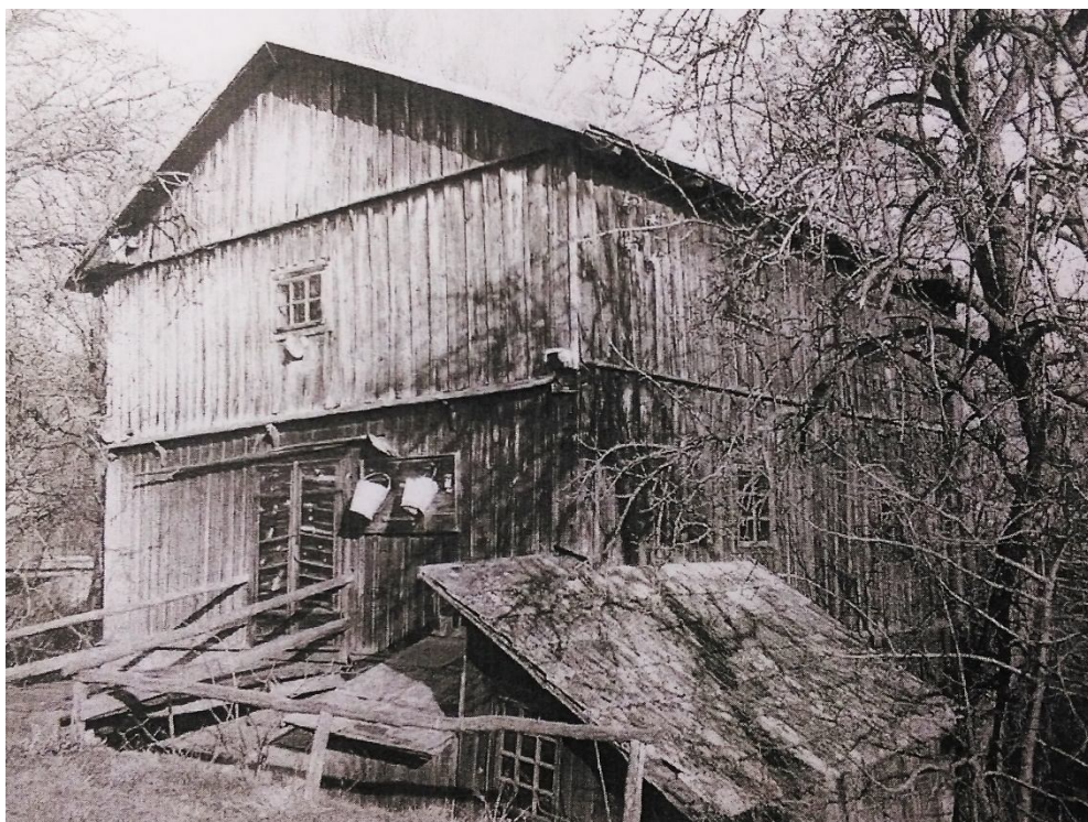
ZDJĘCIE 5 Zespół zagrody młynarskiej - młyn turbinowy, Kuryłówka, 1928r.