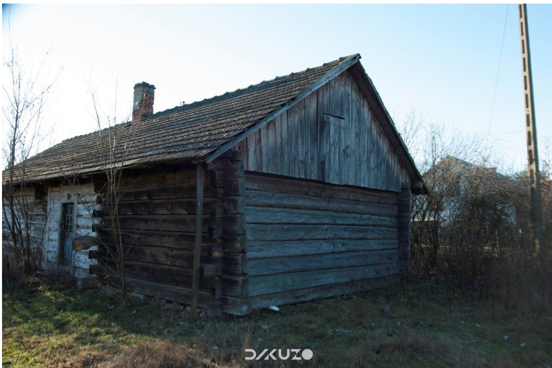
ZDJĘCIE 29 Nieużytkowana chata w Ożannie