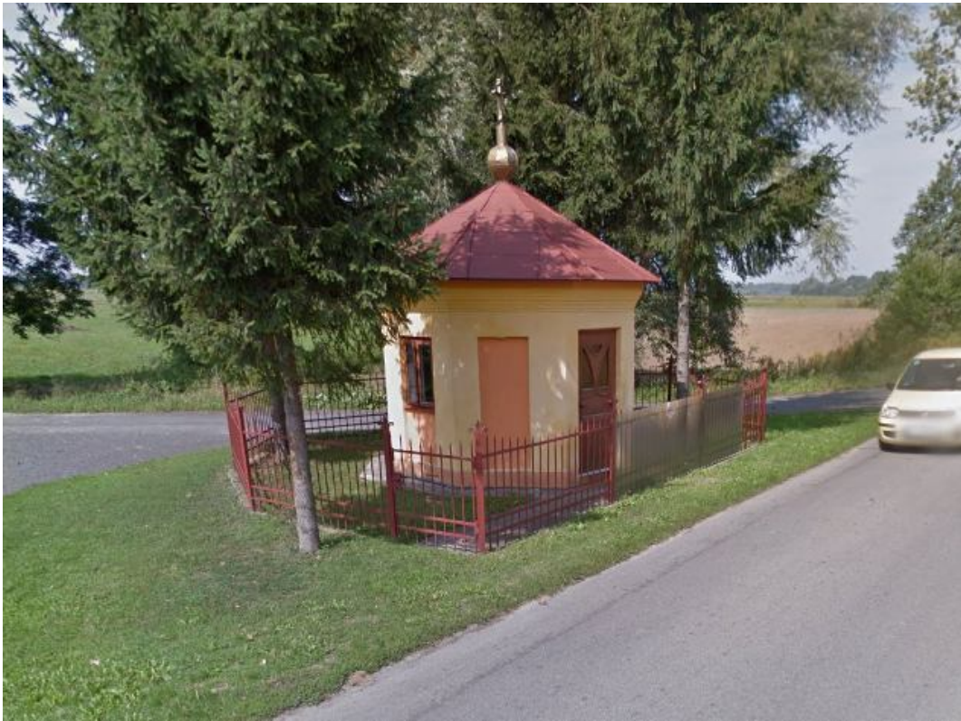
ZDJĘCIE 16 Przydrożna Kapliczka