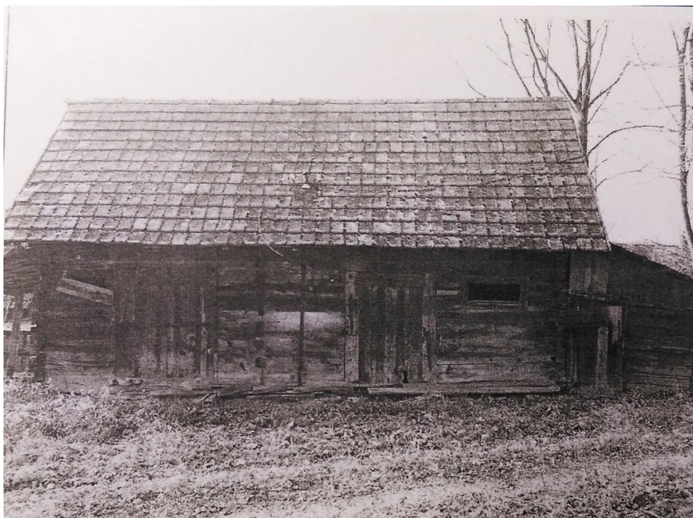
ZDJĘCIE 3 Stajnia w zarodzie nr 34, Ożanna, l.20 XX w.