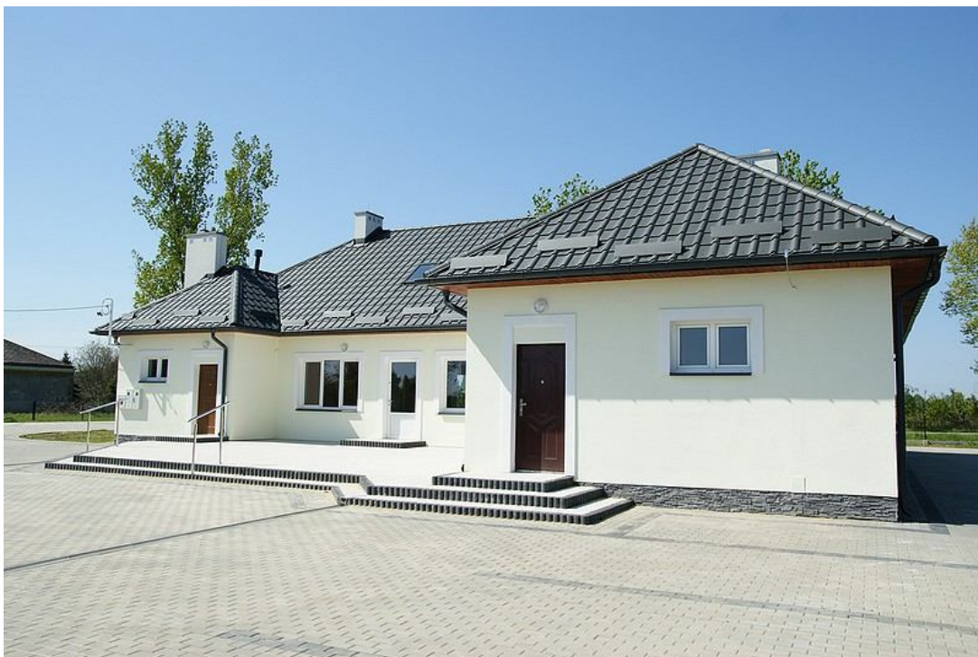
ZDJĘCIE 18 Wiejski Dom kultury w Tarnawcu