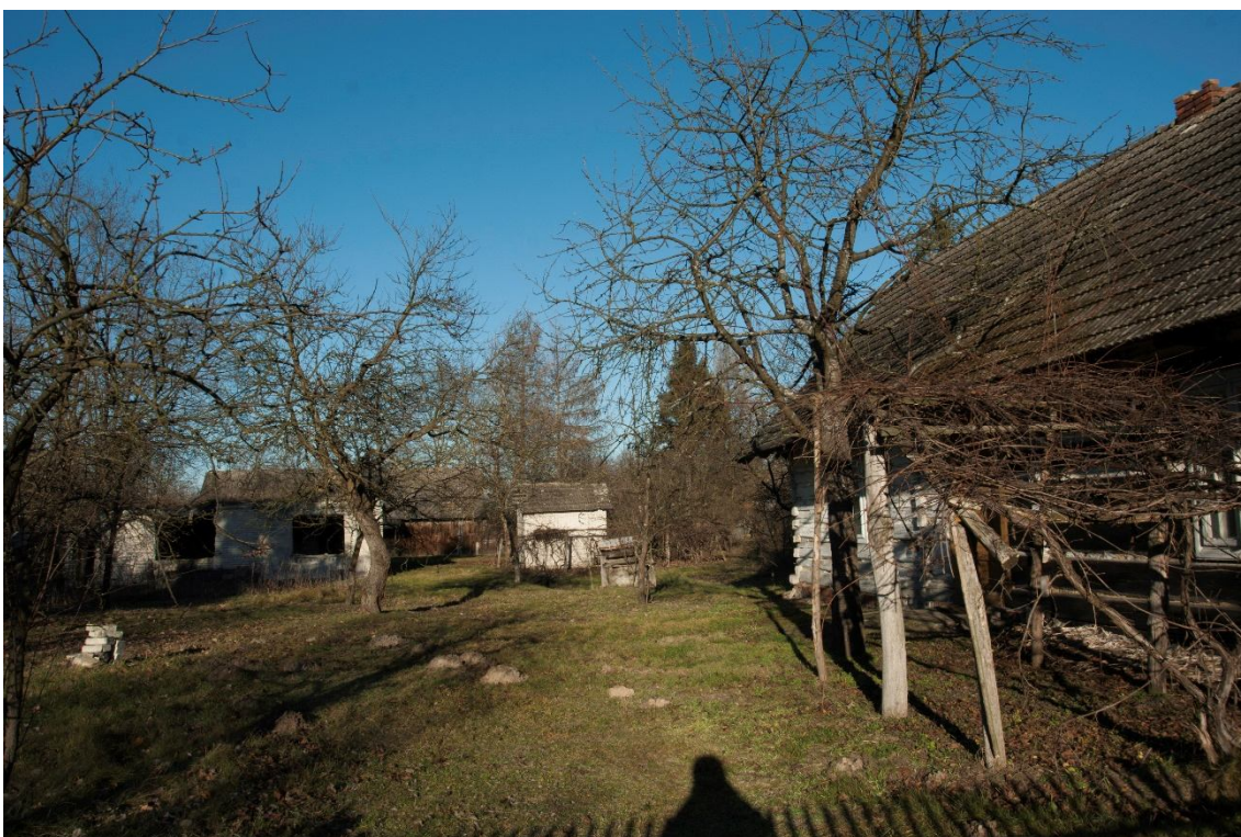
ZDJĘCIE 25 Regionalna chata z początków XXw.