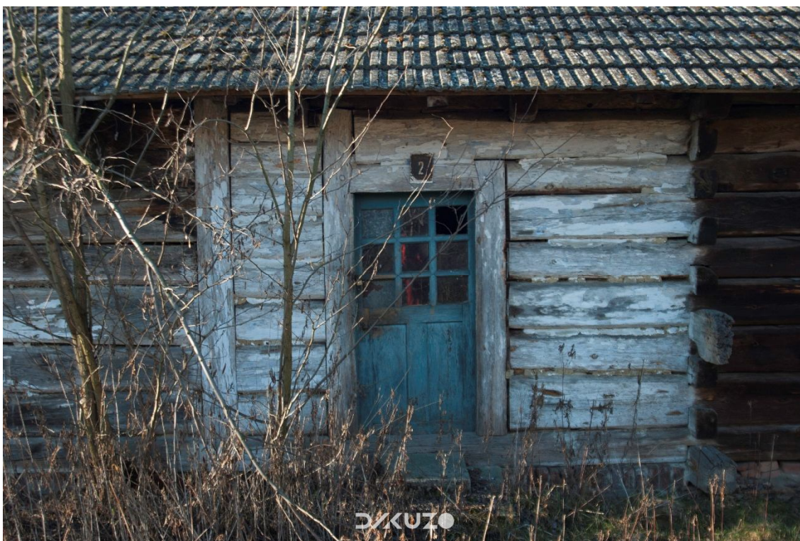
ZDJĘCIE 28 Nieżytkowana chata w Ożannie