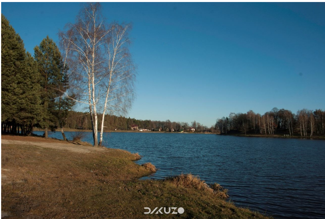
ZDJĘCIE 12 Widok na zalew Ożanna - od strony domków letniskowych