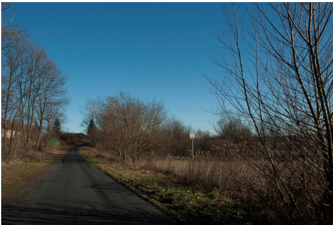
ZDJĘCIE 21 Widok na drogę łączącą Skansen z Kościołem pw. Św. Józefa - trasa rowerowa