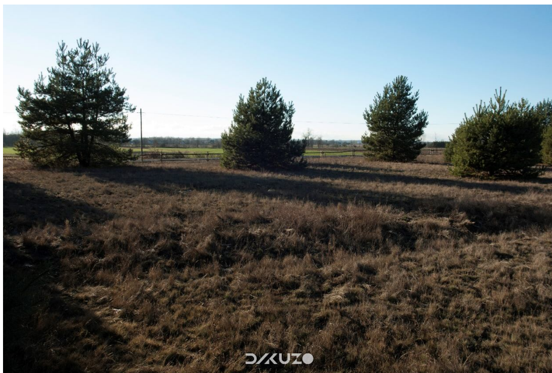
ZDJĘCIE 34 Działka pod skansen. Widok od centralnej części działki w stronę drogi gminnej.