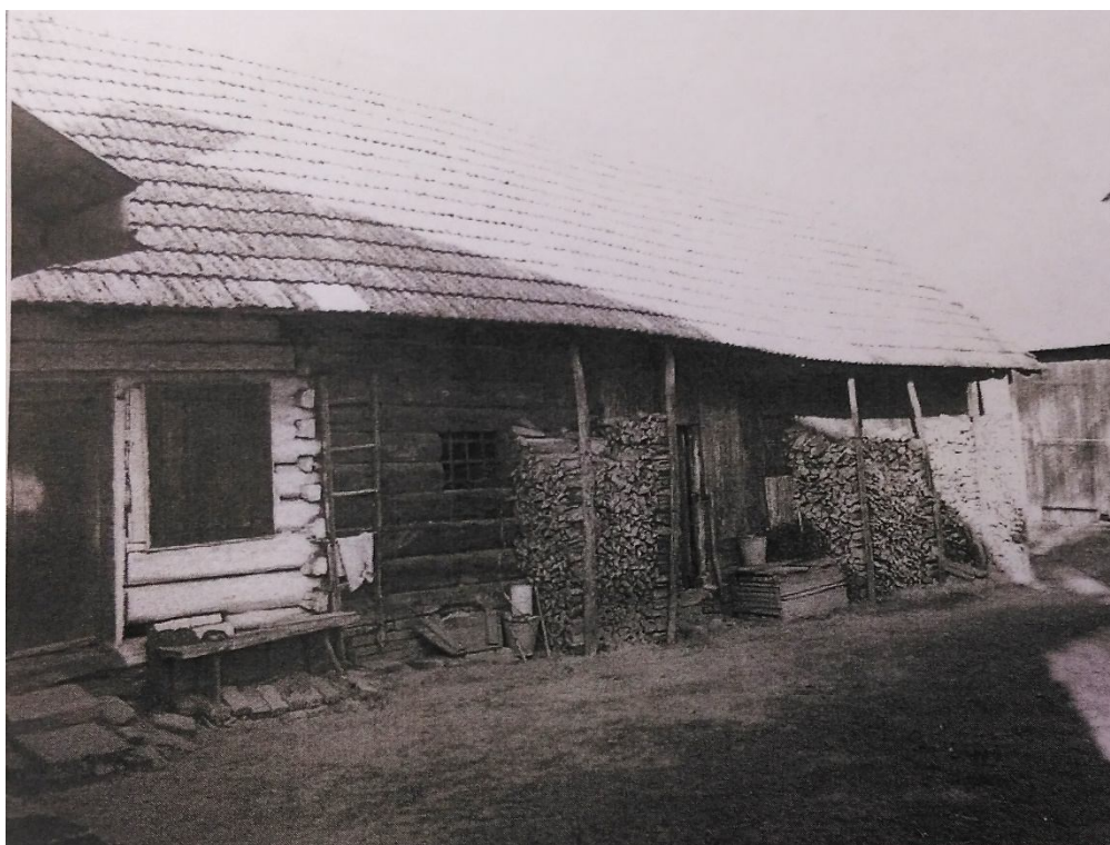
ZDJĘCIE 6 Stajnia w zagrodzie nr 208, Kuryłówka, pocz. XXw.