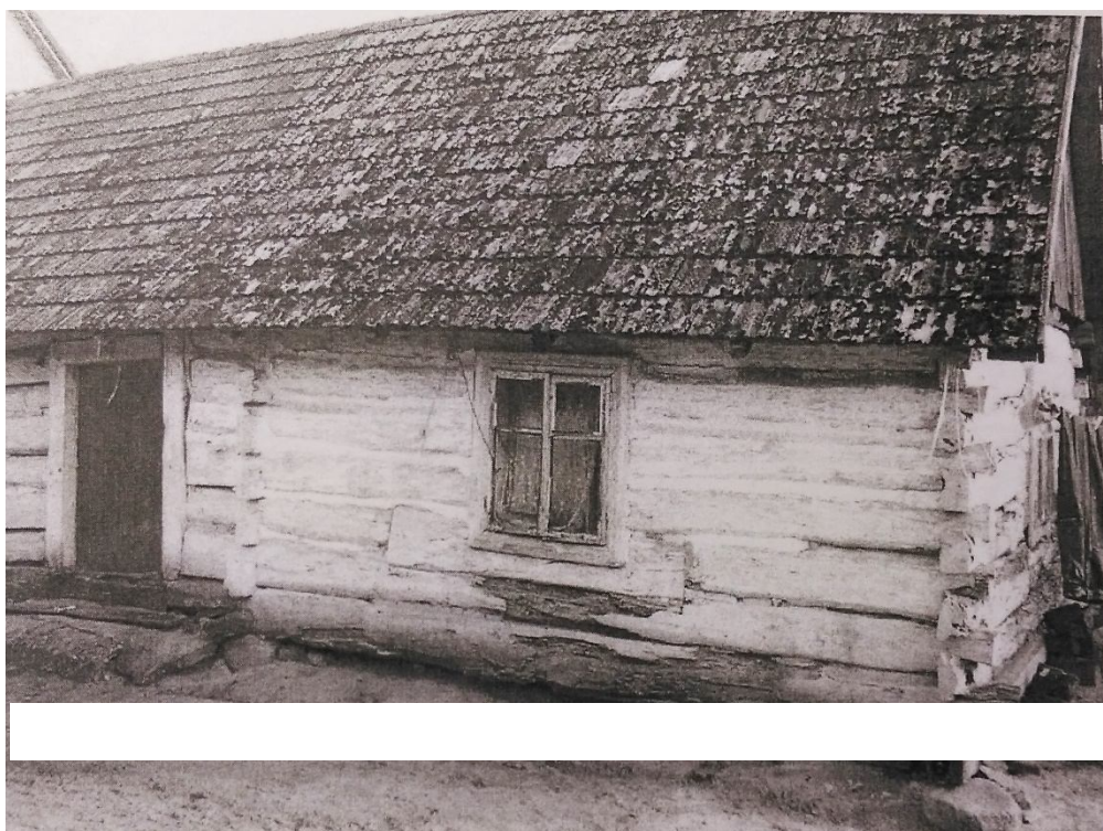
ZDJĘCIE 2 Dom nieużytkowany Ożanna 4