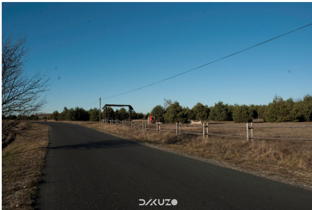
ZDJĘCIE 32 Działka do zagospodarowania. Widok od strony ulicy

Na przedmiotowej działce brak istniejącej zabudowy. Na terenie znajduje się zieleń niska i wysoka. Zieleń wysoka to głównie drzewa i krzewy iglaste. Działka od strony północnej sąsiaduje z lasem, od strony południowej graniczy z drogą – która jest głównym ciągiem komunikacyjnym od Kuryłówki do Ożanny. Od strony zachodniej teren sąsiaduje z polami natomiast od wschodu z gospodarstwem.