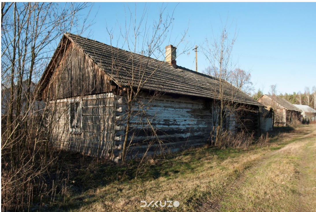
ZDJĘCIE 27 Nieżytkowana chata w Ożannie