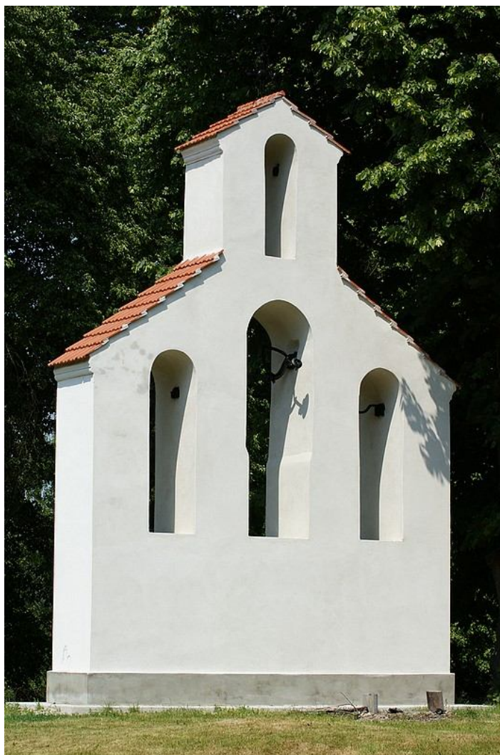
ZDJĘCIE 14 Dzwonnica