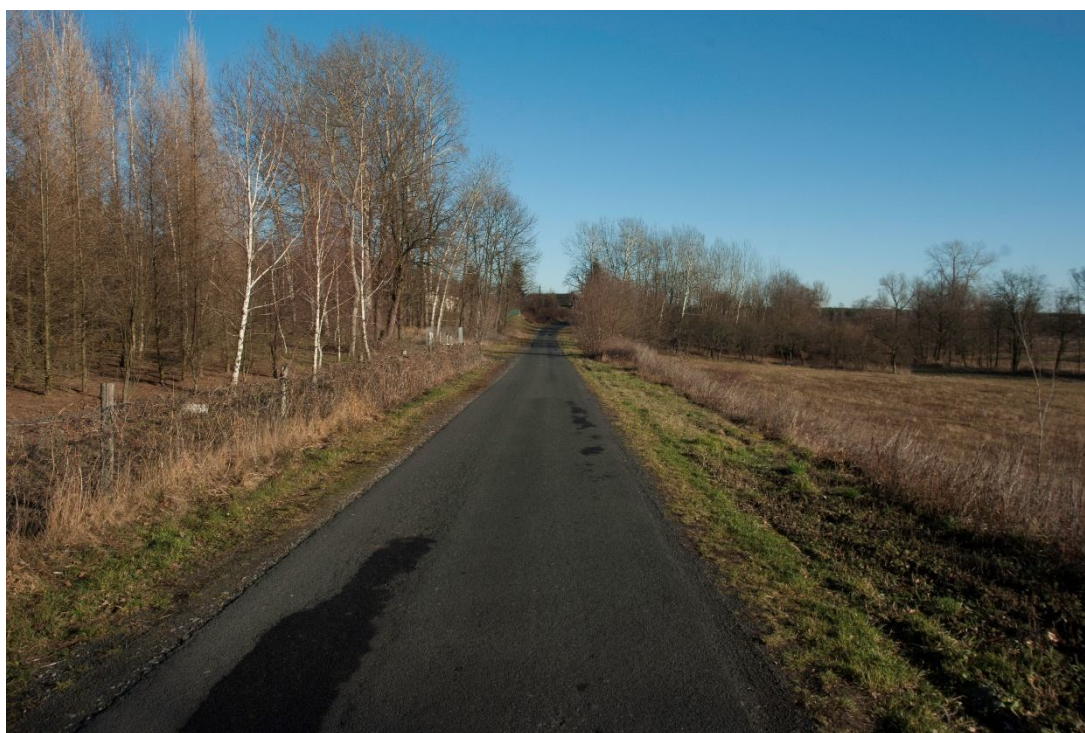
ZDJĘCIE 19 Widok na rzekę Złotą.