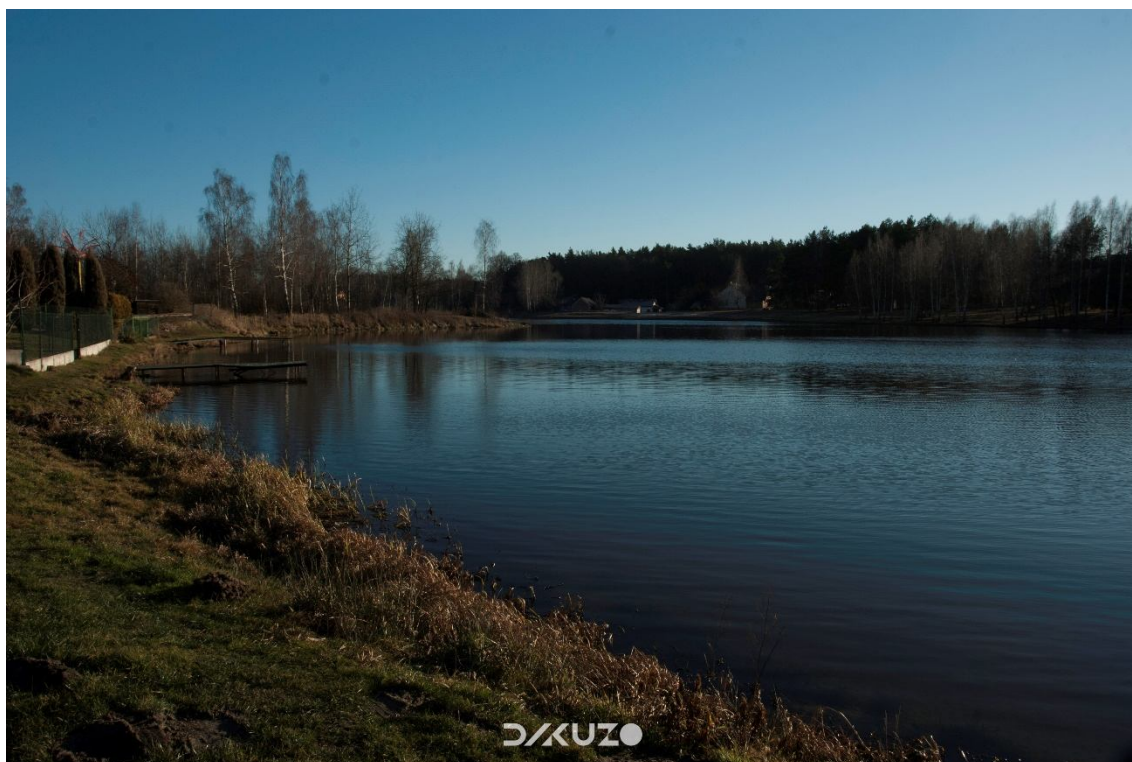
ZDJĘCIE 10 Widok na Zalew Ożanna