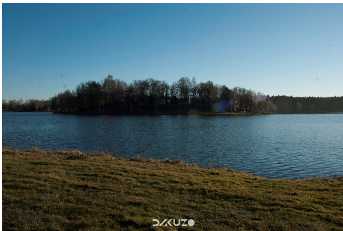
ZDJĘCIE 11 Widok na zalew Ożanna- od strony domków letniskowych.