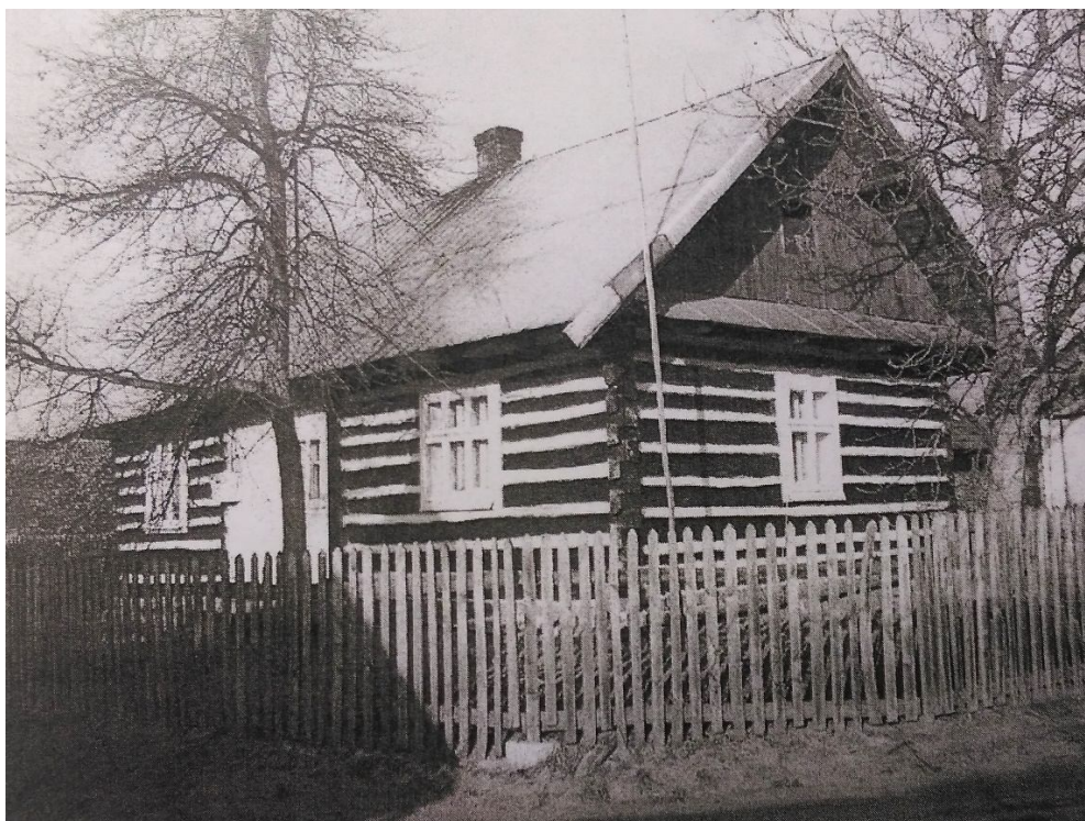
ZDJĘCIE 7 Dom mieszkalny nr 208 Kuryłówka, pocz. XXw.