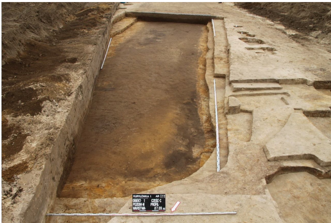
ZDJĘCIE 9 Stanowisko 1. Obiekt 1, poziom M. Oprac. Mirosław Mazurek, Aleksandra Sznajdrowska