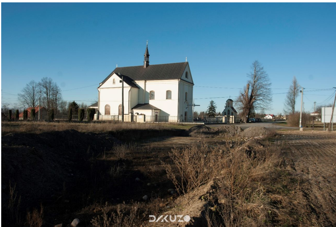
ZDJĘCIE 13 Kościół pw. Św. Józefa w Kuryłówce