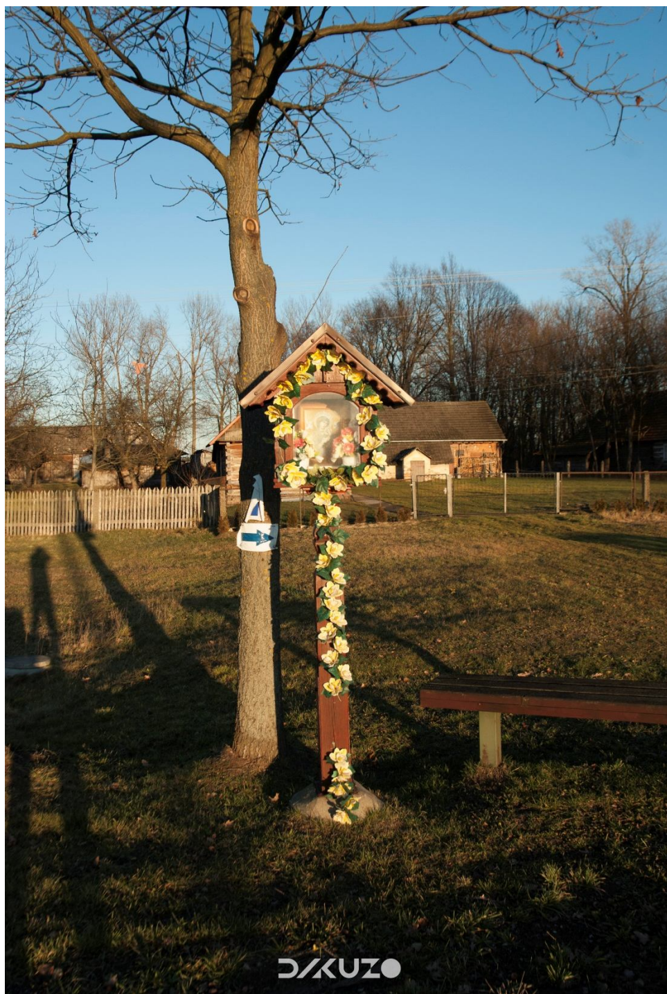
ZDJĘCIE 15 Przydrożna figurka