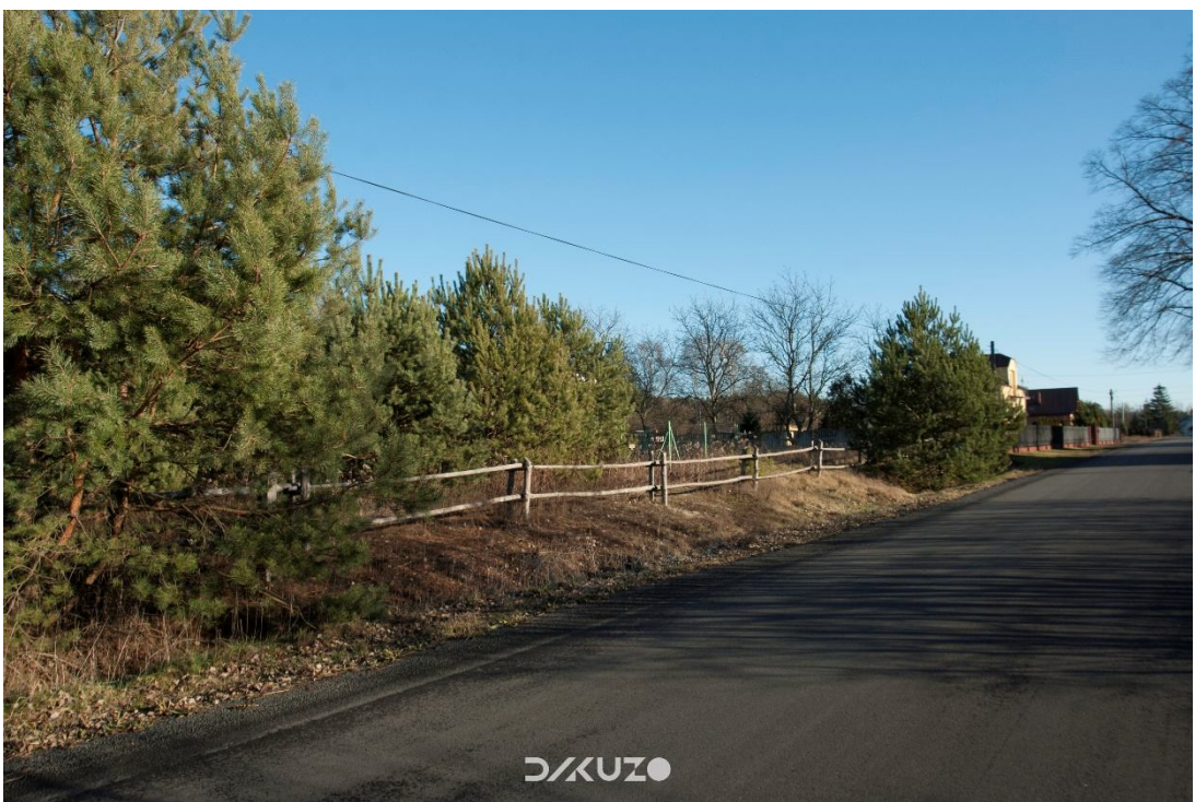
ZDJĘCIE 37 Działka do zagospodarowania. Widok z drogi gminnej na działkę.