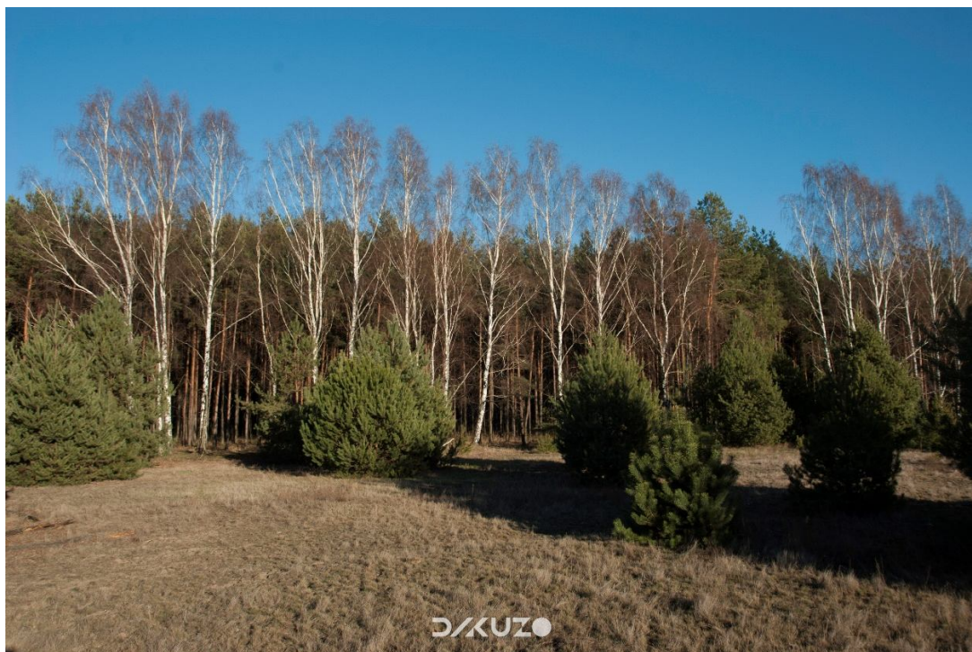
ZDJĘCIE 35 Działka do zagospodarowania. Widok na stronę północną.