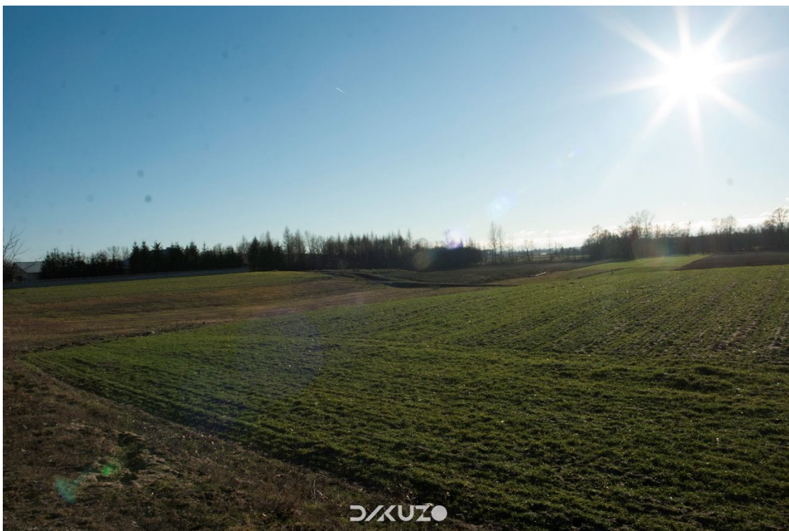
ZDJĘCIE 22 Widok na przydrożne pola