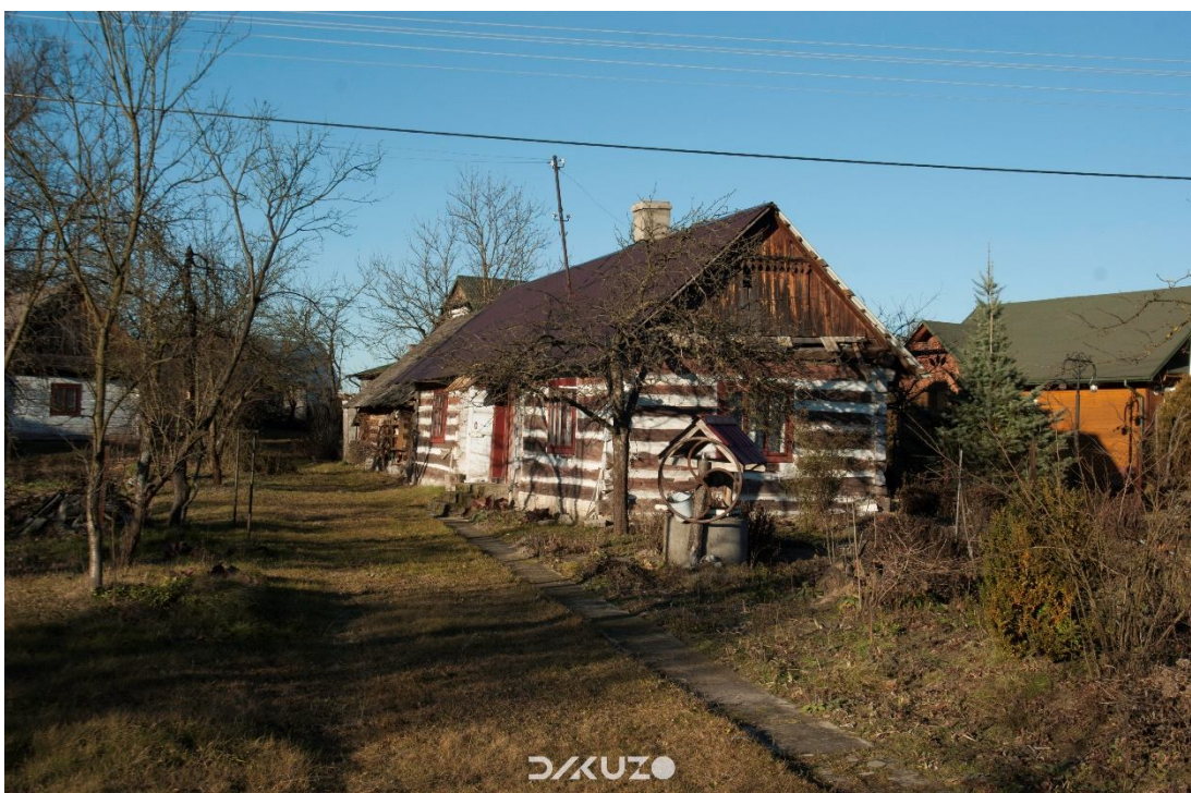
ZDJĘCIE 30 Regionalna chata w Ożannie