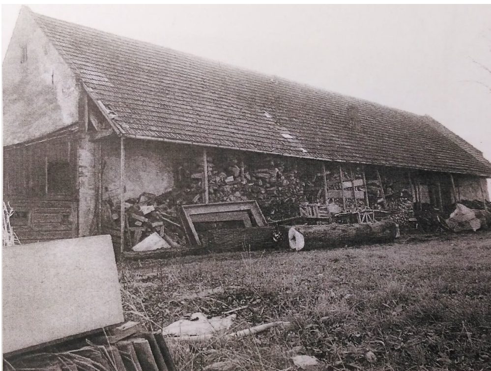
ZDJĘCIE 4 Pozostałości zespołu folwarcznego, ob. Kościół rzym-kat. P.w. Św. Józefa - stajnia plebańska, II poł. XVIIIw., Kuryłówka