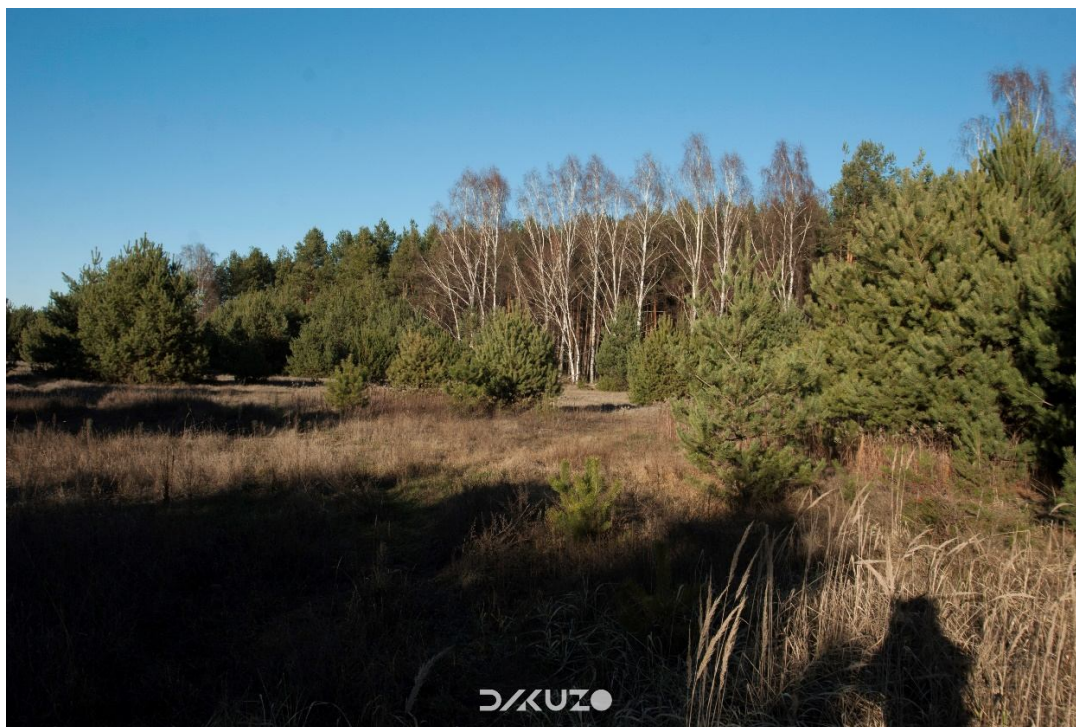
ZDJĘCIE 33 Działka do zagospodarowania. Zieleń średniowysoka