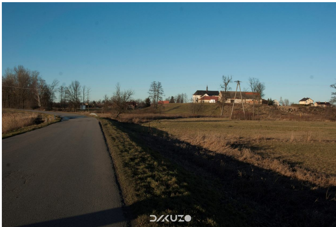
ZDJĘCIE 23 Widok na wzgórze z Kościołem pw. Św. Józefa i stajnię plebańską.