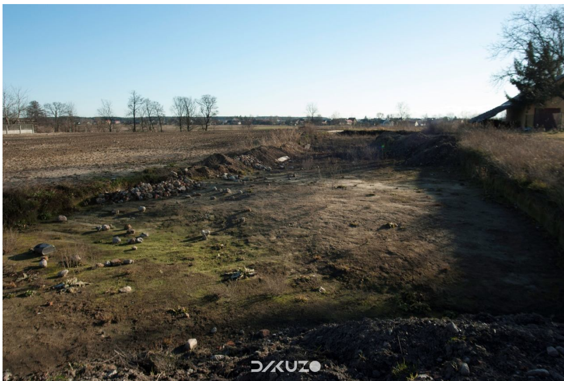
ZDJĘCIE 8 STANOWISKO ARCHEOLOGICZNE, WIDOK Z ULICY.