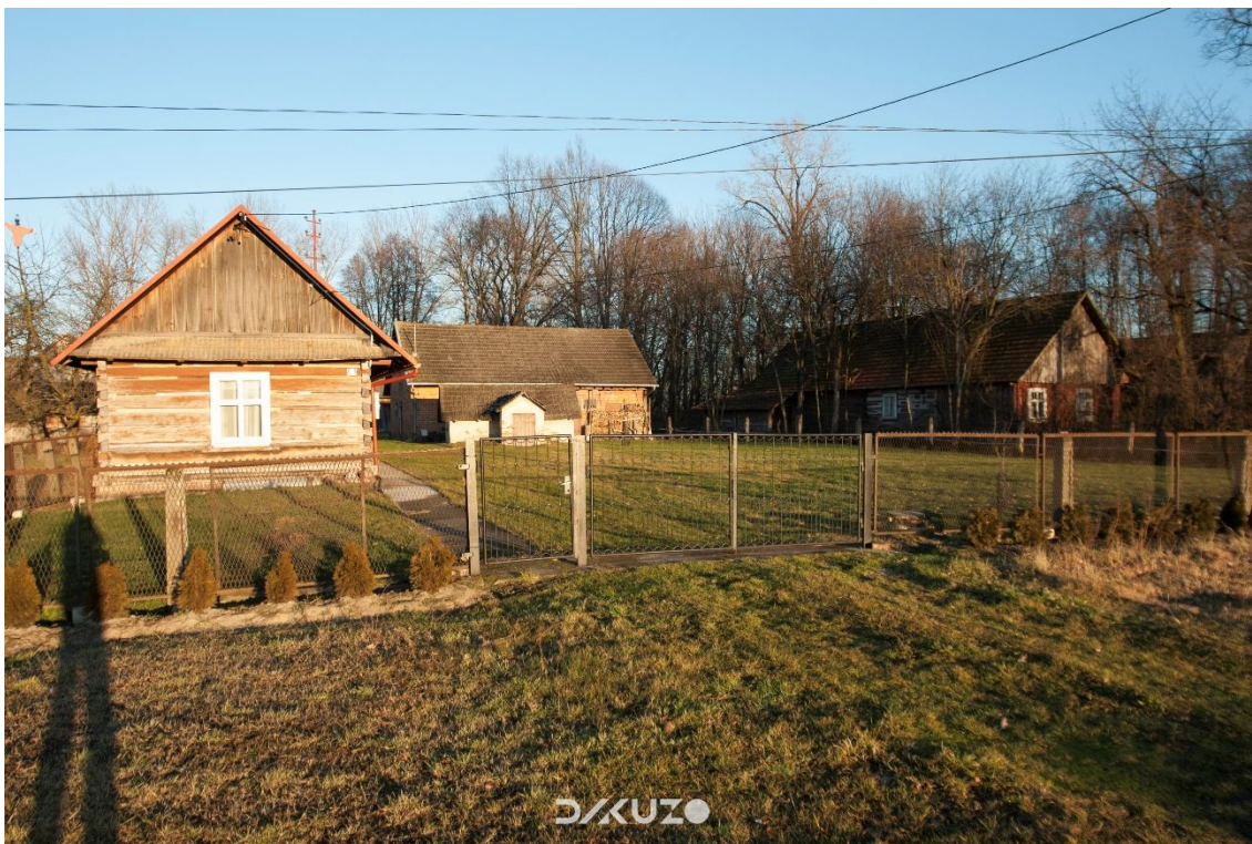
ZDJĘCIE 31 Regionalna chata wraz z budynkami gospodarczymi