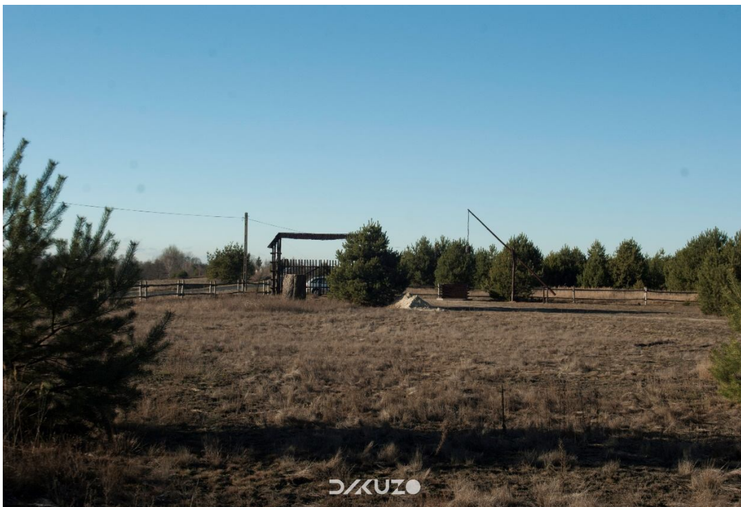
ZDJĘCIE 36 Działka do zagospodarowania. Widok na stronę zachodnią.