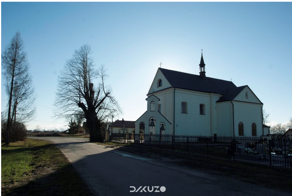
ZDJĘCIE 1 Kościół parafialny p.w. Św. Józefa w Kuryłówce

Na terenie gminy i analizowanego terenu istnieje wiele obiektów wpisanych do gminnej ewidencji zabytków. Są to m.in.