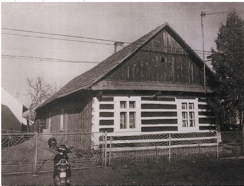
ZDJĘCIE 2 Dom mieszkalny nr 6 w Tarnawcu , 1921r.