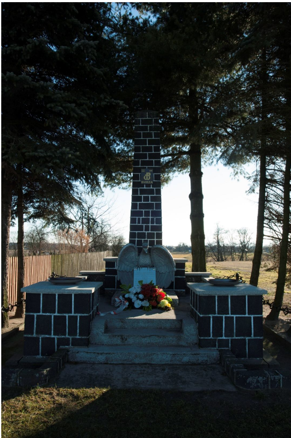
ZDJĘCIE 17 Pomnik pamięci AK